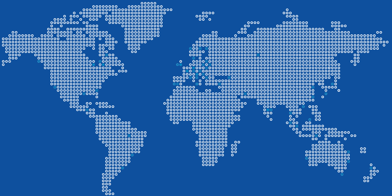
Produktions- und Vertriebsstandorte der LEITZ-Group Production and sales locations of the LEITZ Group

BILZ WERKZEUGFABRIK GmbH & Co. KG Vogelsangstr. 8 73760 Ostfildern Deutschland / Germany Telefon +49 711 348 01 - 0 Telefax +49 711 348 12 56 info@bilz.de www.bilz.com